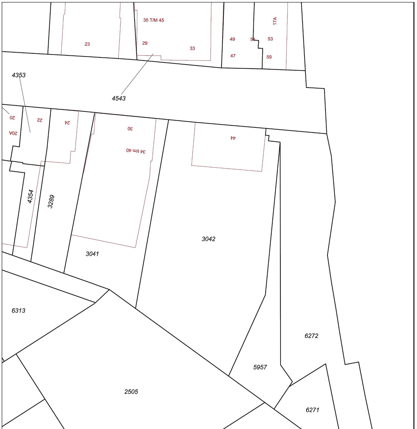
SITUATIETEKENING SCHAAL 1:500