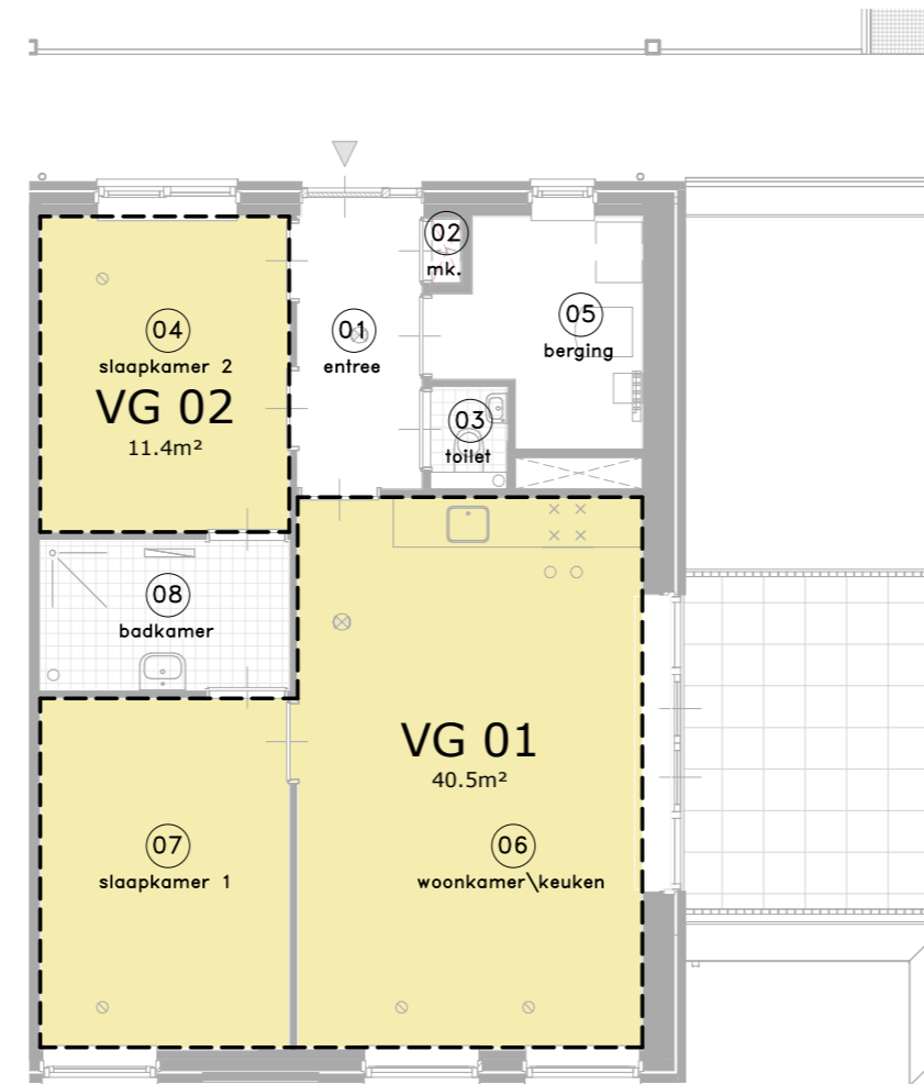
VERBLIJFSGEBIED (VG) - TYPE A4 2e verdieping