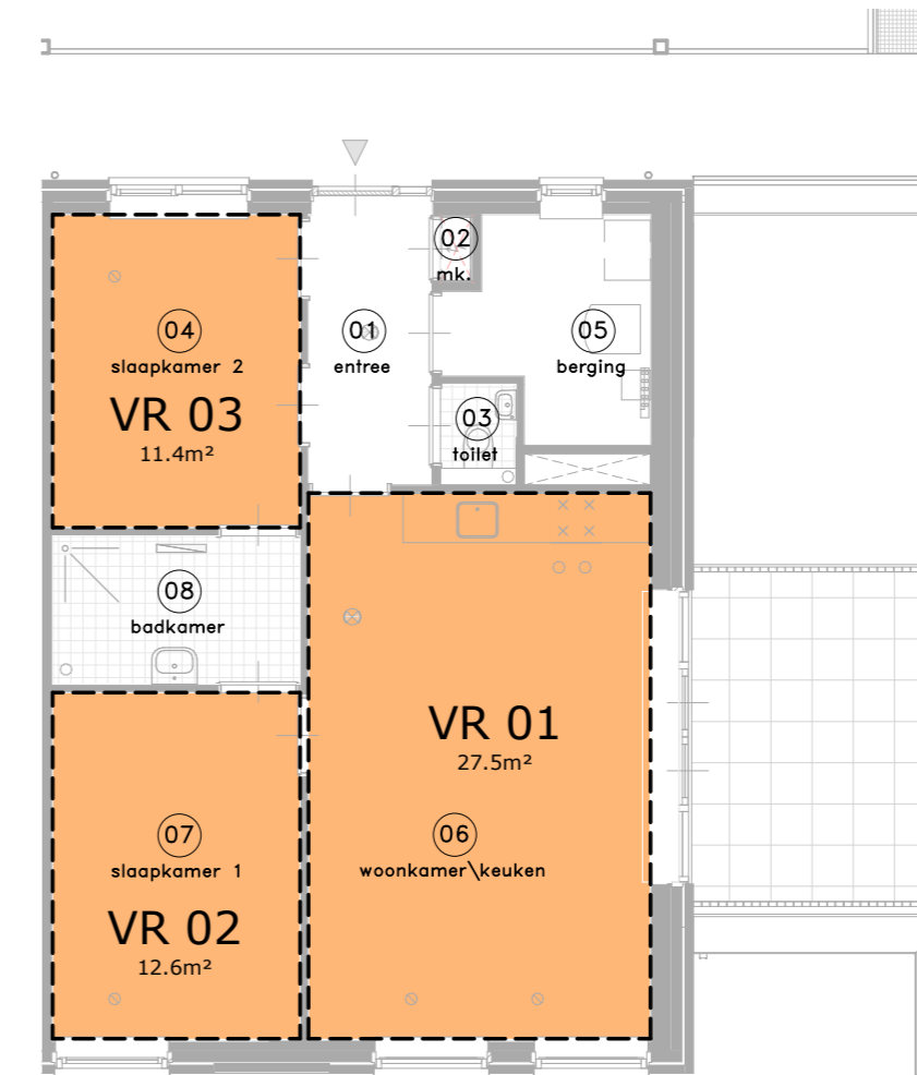
VERBLIJFSRUIMTE (VR) - TYPE A4 2e verdieping