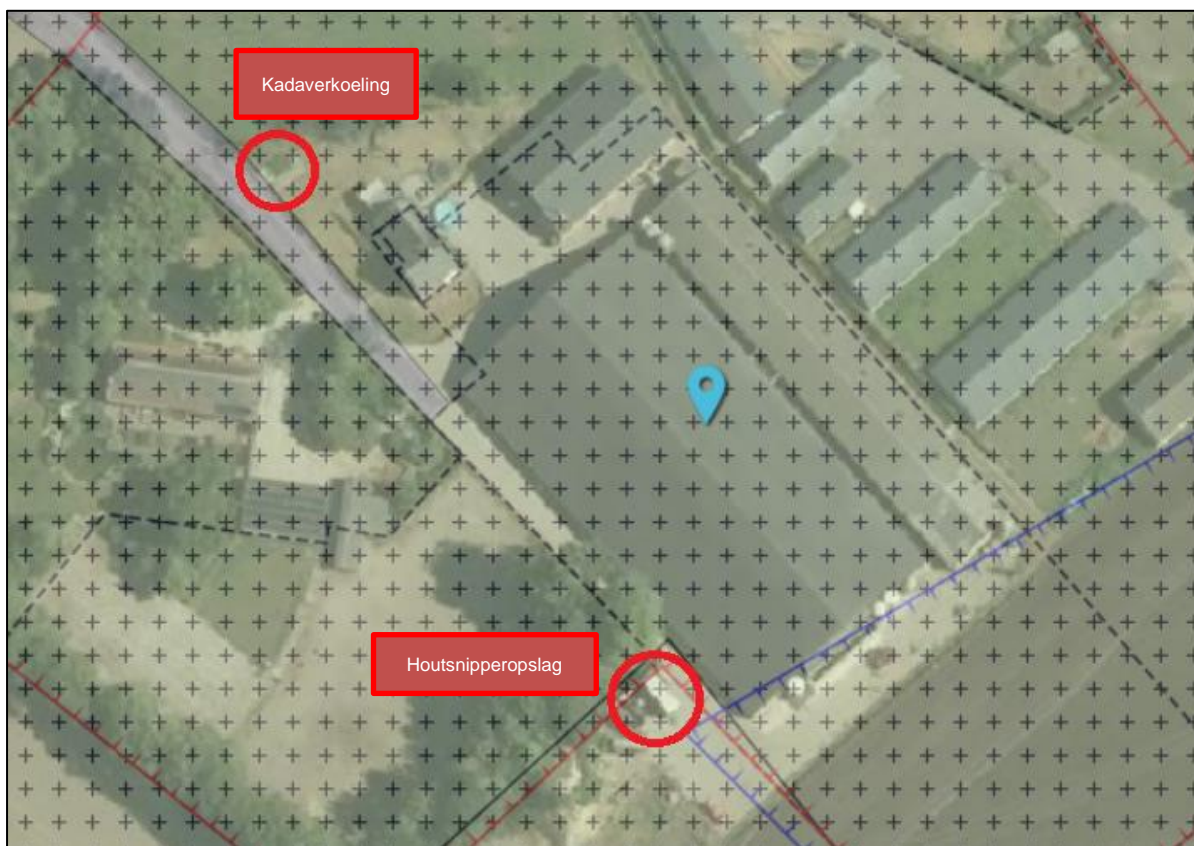
Figuur 1: Uitsnede bestemmingsplan "Buitengebied Nederweert 2011".