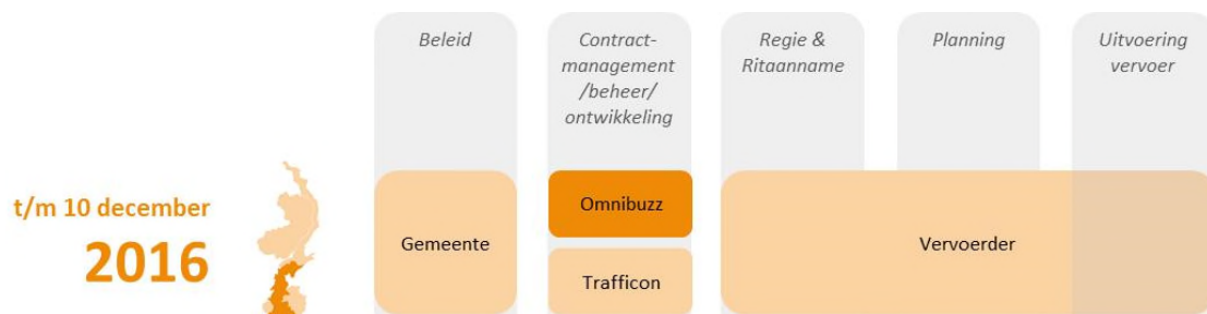
Figuur 4: Schematische weergave van fase tot en met 10 december 2016