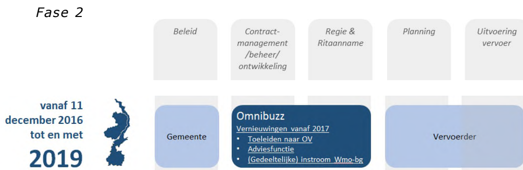
Figuur 5: Schematische weergave vanaf 11 december 2016 tot en met 2019