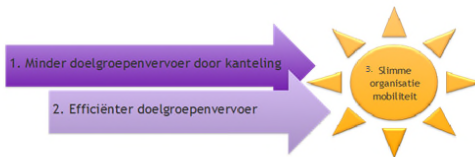
Figuur 2: Visualisatie visie Omnibuzz

De visie van Omnibuzz om dit te realiseren leunt op drie belangrijke pijlers, 1. Het kantelen van vervoer en OV gebruik stimuleren; 2. Het efficiënter organiseren van doelgroepenvervoer en 3. Aansturing door een slimme organisatie.