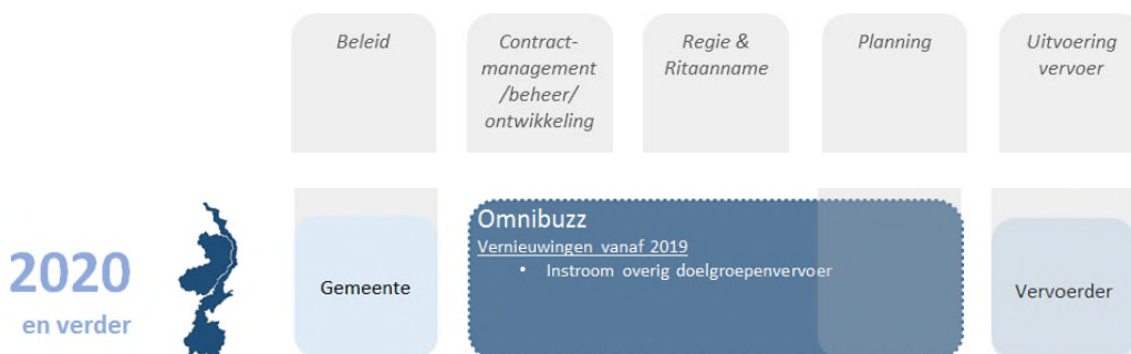
Figuur 6: Schematische weergave fase van 2020 en verder