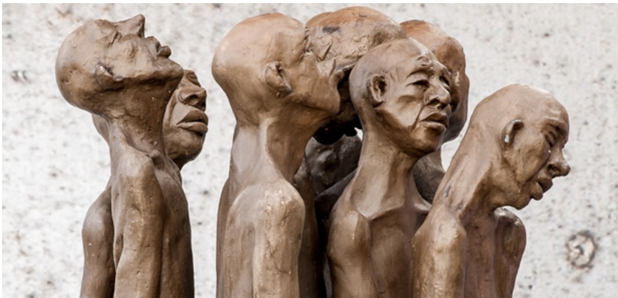
Een kunstwerk van Olga Salmans dat te zien was bij de expositie in 2019 "Deuren van Dementie" Pop Up Galerie Nederweert (PUGN)