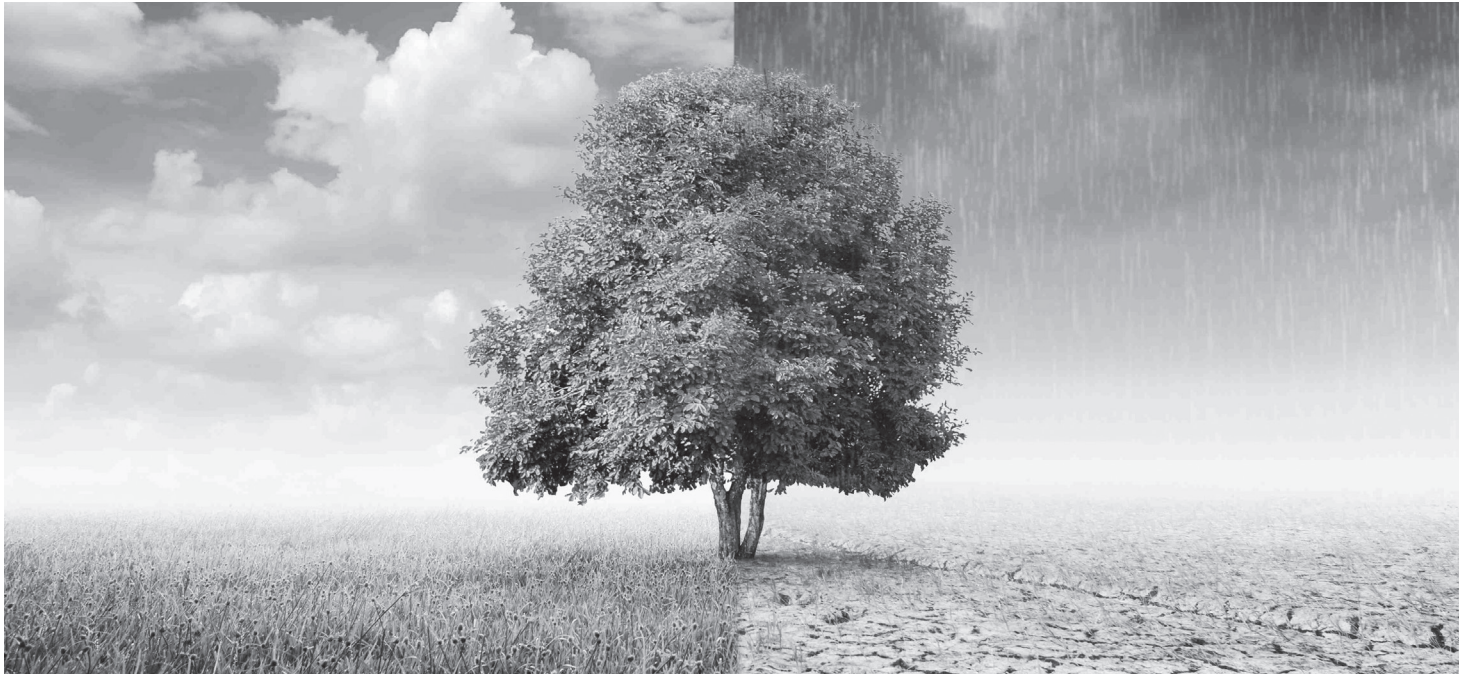
Voorbereid de toekomst in. Ook op het gebied van klimaat zijn we daarmee bezig.