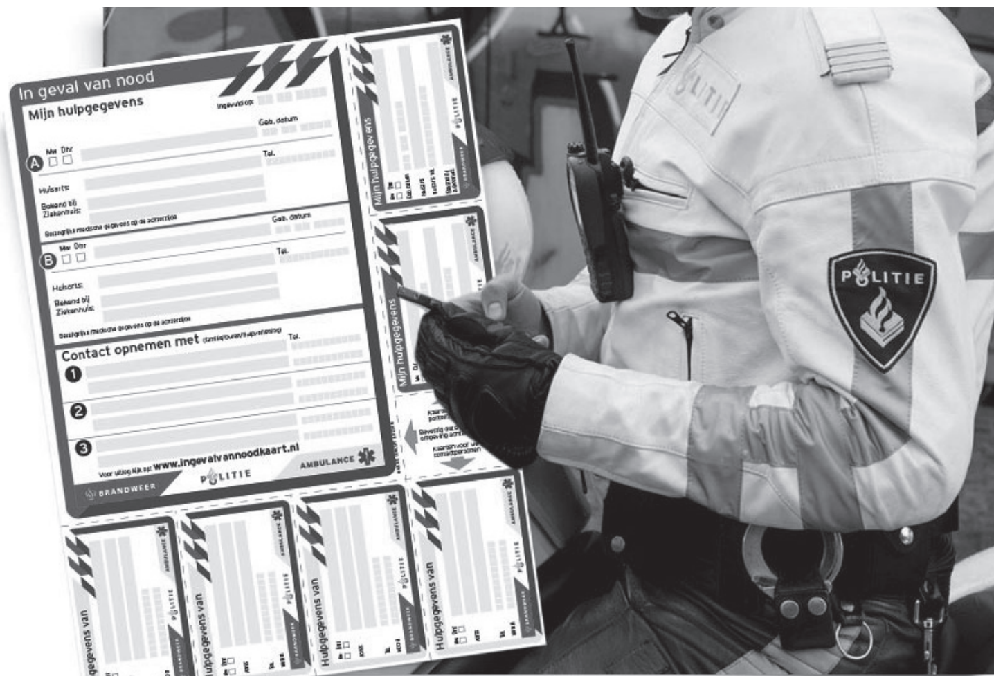
De 'In geval van nood-kaart' helpt hulpverleners in noodsituaties om snel te kunnen handelen

Twijfel niet en neem vrijblijvend contact op met VAO via info@vaoweert.nl of 06 22787418. Alle vrijwilligers zijn opgeleid, hebben een contract met geheimhoudingsplicht getekend en ze beschikken over een Verklaring Omtrent Gedrag.