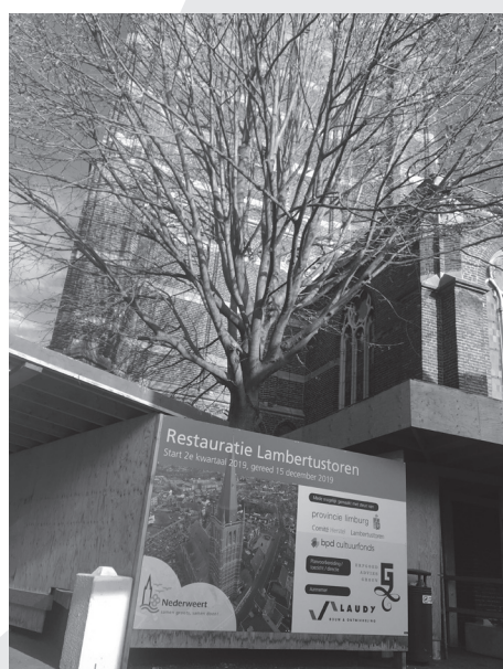
De restauratie wordt mede gesteund door:

trouwen in dat de aannemer de restauratie tot een goed einde brengt. Hierna zullen we het werk feestelijk opleveren", aldus burgemeester Evers.